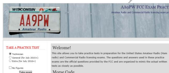
図 2 書籍および模擬試験ホームページ

「W5YI-VEC 札幌試験チーム」による FCC 試験は、年間 4 回程度を計画しています。 試験日時については「(有) フェイズ・サッポロ」ホームページにてご確認ください。